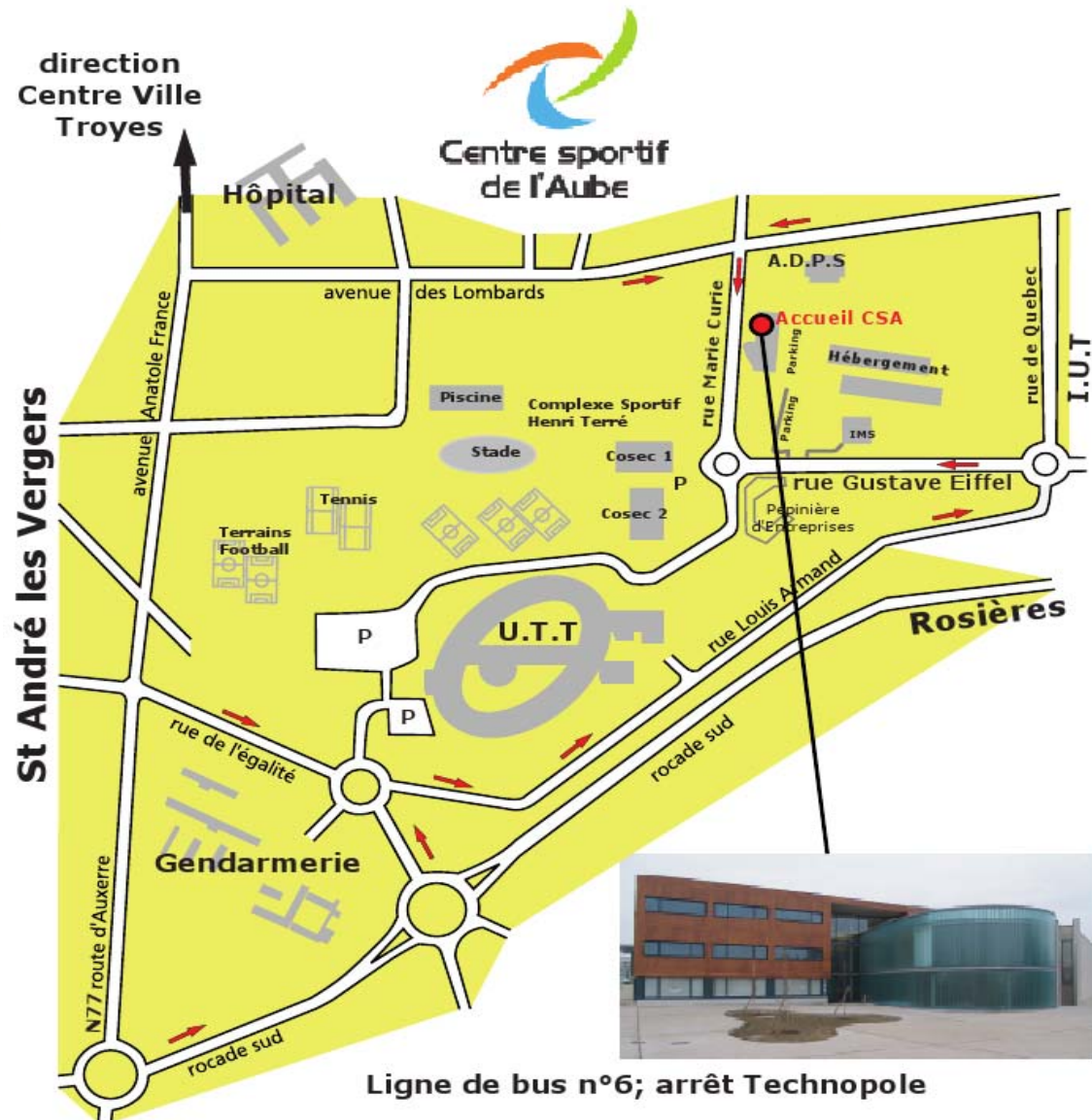
Ligne de bus n°6; arrêt Technopole