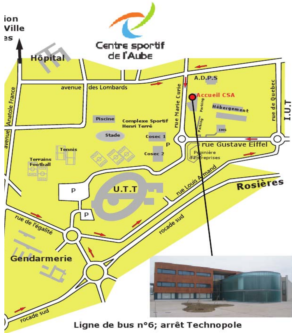
Ligne de bus n°6; arrêt Technopole